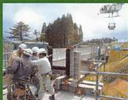
■建設中的九重夢大吊橋...