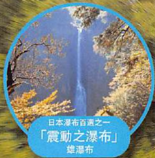
日本瀑布百選之一 「震動之瀑布」 雄瀑布