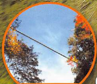
從楓葉中往下眺望