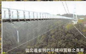
從北邊看到的吊橋和震動之瀑布

●2006年10月30日/開幕 ●2007年4月10日/達到100萬人 ●2007年9月16日/達到200萬人(第322天) ●2008年4月4日/達到300萬人(第522天) ●2008年11月17日/達到400萬人(第750天) ●2009年10月15日/達到500萬人(第1,082天) ●2010年11月8日/達到600萬人(第1,471天) ●2012年4月13日/達到700萬人(第1,993天) ●2013年7月1日/達到777萬人(第2,437天) ●2013年10月21日/達到800萬人(第2,549天) ●2015年6月5日/達到900萬人(第3,141天) ●2017年3月1日/達到1,000萬人(第3,776天)