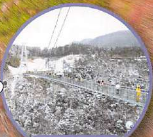
白雪裝飾下的大吊橋