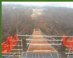
○ 시공/가와타(川田) 공업(주)