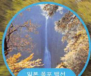
일본 폭포 백선 신도노타키 폭포 오타키(남자폭포)