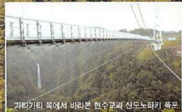
기타가타 쪽에서 바라본 현수교와 신도노타키 폭포