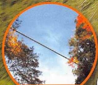
단풍 속에서 올라다 본 현수교 모습