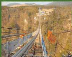
○ 설계/일본 엔지니어링(주)